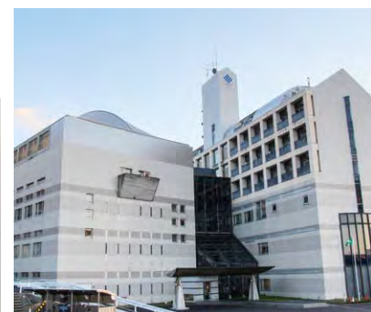
四電工社員研修所(香川県)