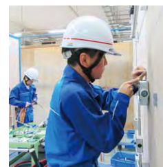
新入社員研修(左:座学、右:実技)